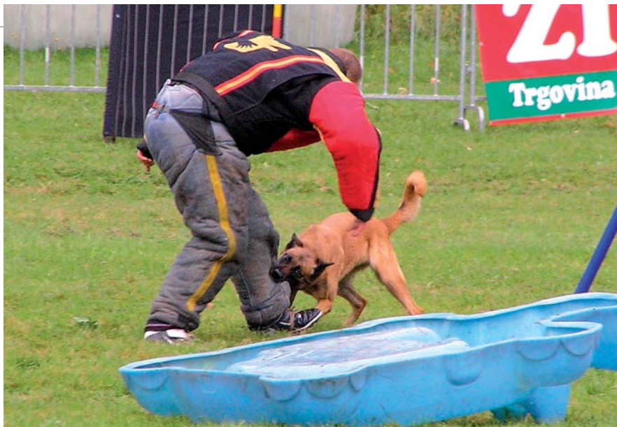
■ Tvrdost a ovladatelnost využije v Ringu a Mondioringu

Nedoceněnou kladnou stránkou belgičáků je bezesporu jejich dlouhověkost a vitalita. Běžný věk dožití je mezi třinácti a patnácti lety, výjimkou nejsou ani sedmnáctiletí psi (tohoto věku se dožil i první importovaný BO do ČR – Adriano). Nejen že se vysokého věku dožívají, oni ho dosahují ve skvělé kon-