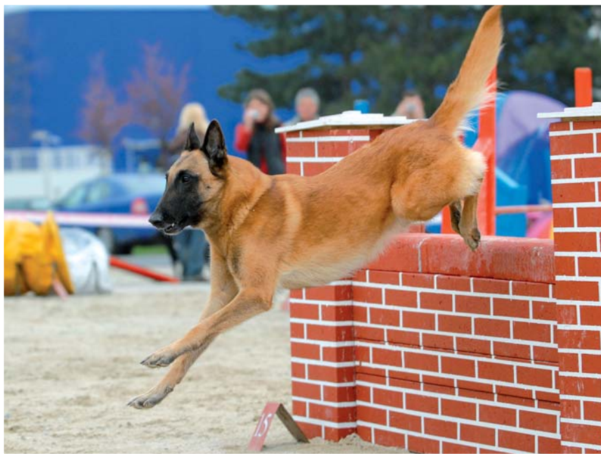
■ Agility je doménou belgického ovčáka

Po první světové válce musel klub udělat ústupek a v rámci zachování plemene uznal v roce 1920 také dlouhosrsté červenohně-