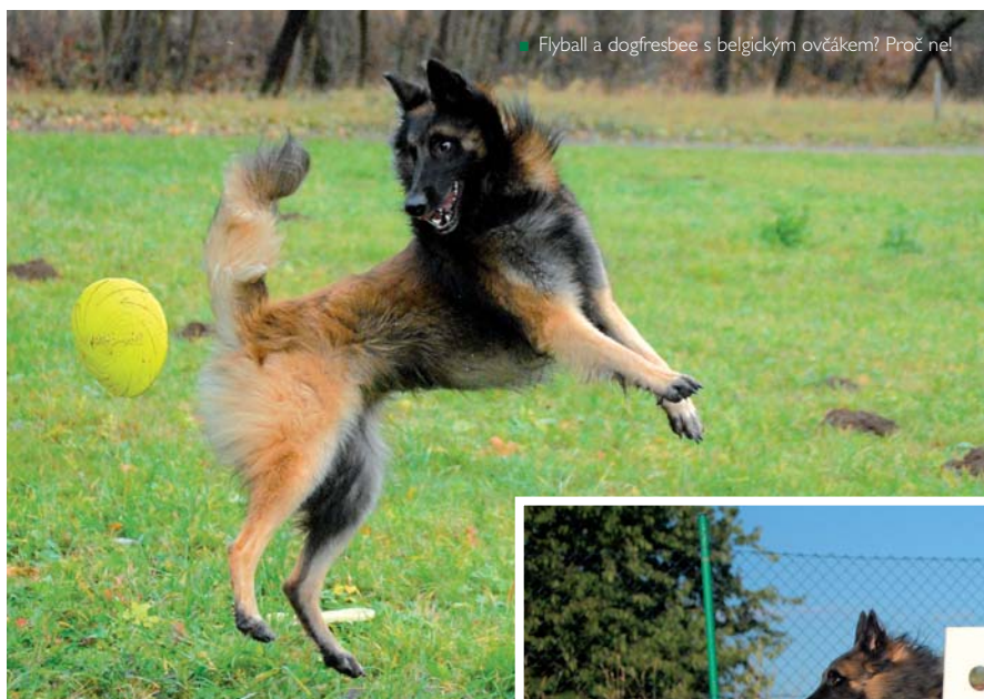
■ Flyball a dogfresbee s belgickým ovčákem? Proč ne!

OPI, IPO3) a fenka Halusetha's Teekla (Ch. ČSFR, ZM). Ve stejném roce se dalším chovatelům podařilo dovést z Holandska fenu Sonja v.Tasca's Home (r. CACIB, ZVV3, IPO3, ÚMS BO) a fenu z Belgie Mero du Maugré (Int.Ch., ZVV2, ZLP2, ZPP2, IPO2, 2x ÚMSAgI).